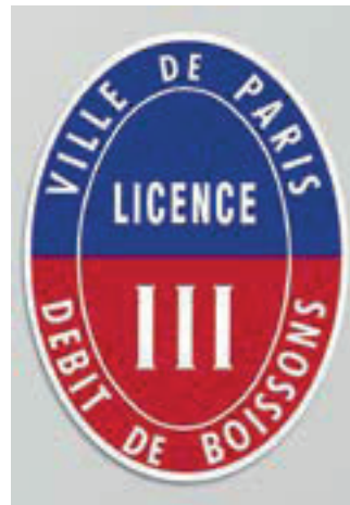
La licence à afficher dans votre établissement dépendra de la classification des boissons vendues et de leur moment de consommation

Le programme des formations initiales et de mise à jour des connaissances...est constitué d'enseignements d'une durée de sept heures en une journée. ▀